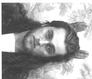
DAMIEN ROUXEL NÉ EN 1993, IL VIT ET TRAVAILLE À QUIMPER.

Pratiquant essentiellement la photographie, la vidéo et la sculpture, Damien Rouxel crée des images fantasmées très documentées, car elles s'inspirent de l'histoire de l'art, de la mythologie ou de l'histoire, souvent avec humour. Si la figure humaine est au centre de ses photographies, c'est pour mieux regarder le « décor » dans lequel il s'immerse, que ce soit la ferme familiale ou d'autres territoires liés à la nature, au travail, à la culture populaire.