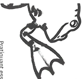
Portrait de Marc'h l'homme-cheval

Théo Guézennec collabore avec des groupes de Langourla, de Launehan et d'Uzel. Au travers d'images romantiques des lieux traversés où se mêleront fiction et mémoire, il souhaite créer des liens entre les trois communes notamment en y organisant des événements.